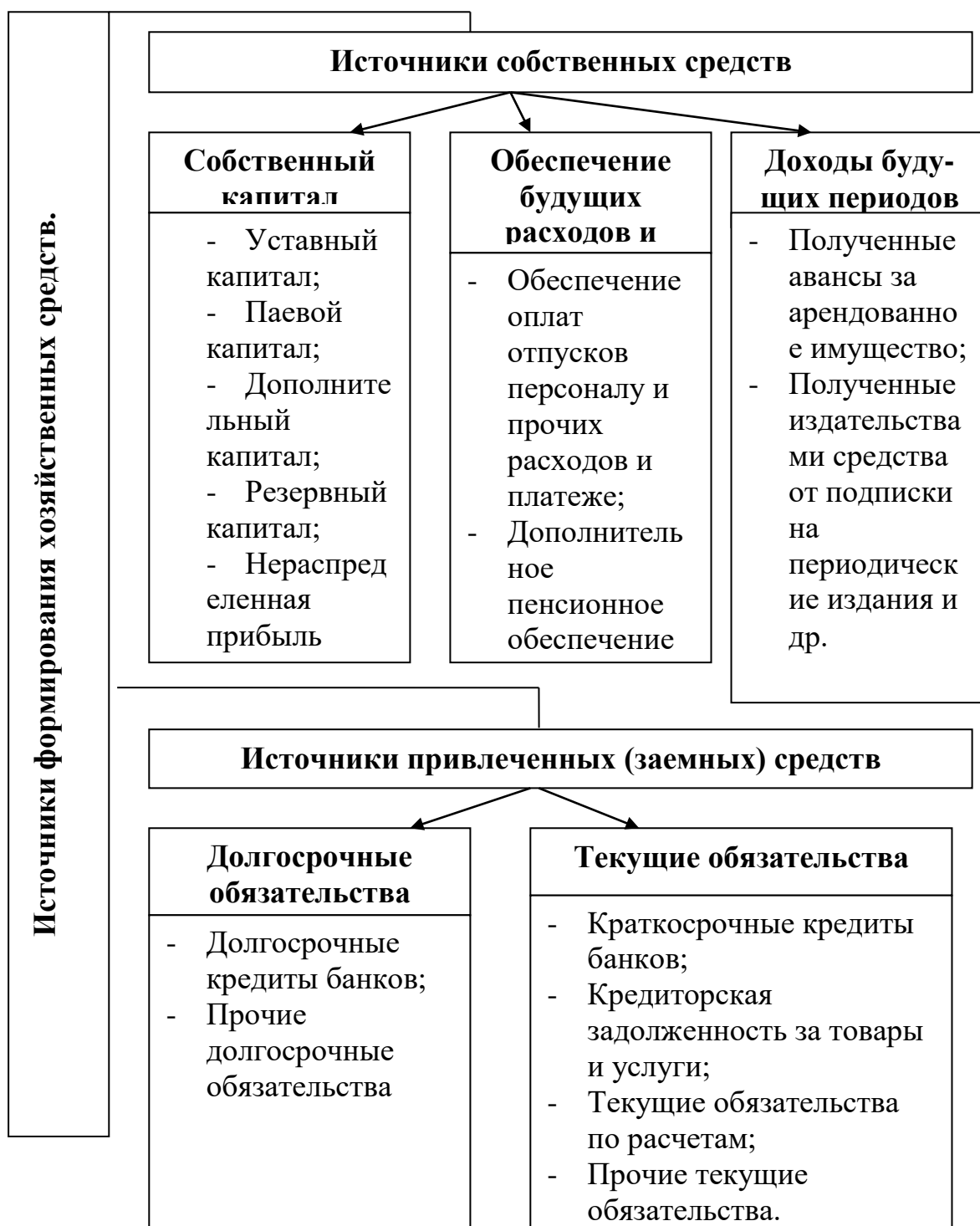
Рис. 1.2 Классификация источников формирования хозяйственных средств предприятия