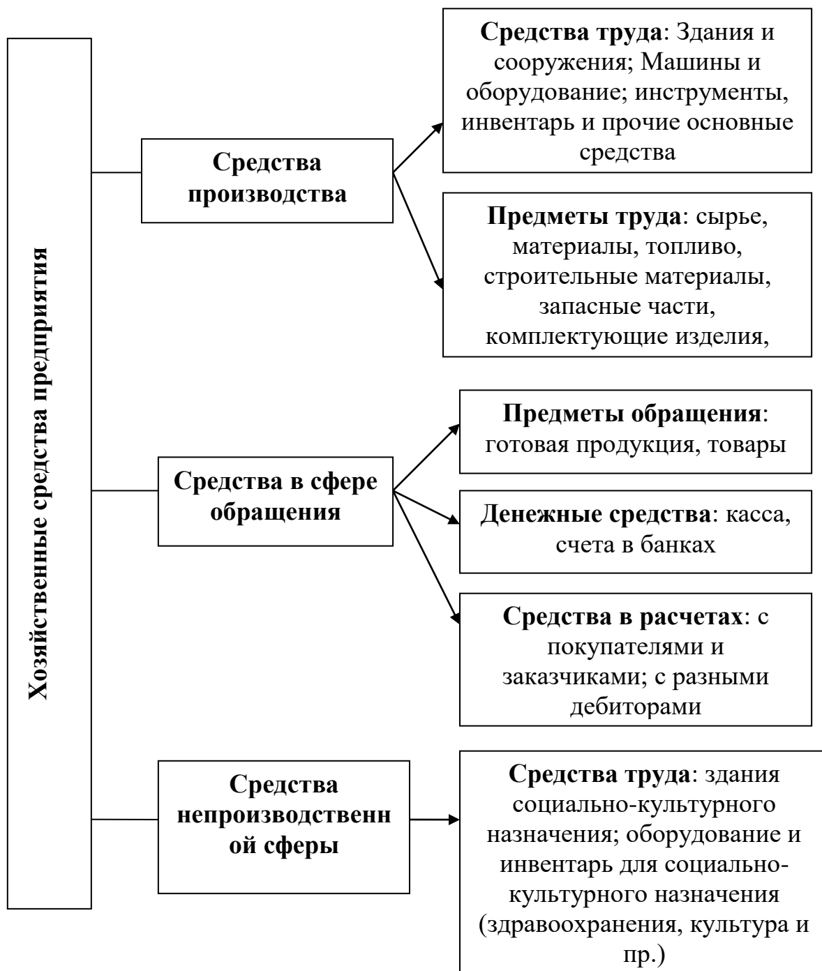
Рис. 1.1. Классификация средства по составу и размещению